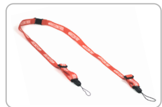
Cinta ajustable WaveMon Ref. WWMA0003

Cinta desabrochable de seguridad para el cuello