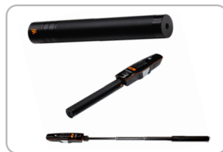
WaveStick Ref. WWMA0002

Mástil de extensión ajustable (73 cm / 28,74 ")