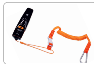
Correa de seguridad Ref. WWMA0001

Mástil de extensión ajustable (73 cm / 28,74 ")